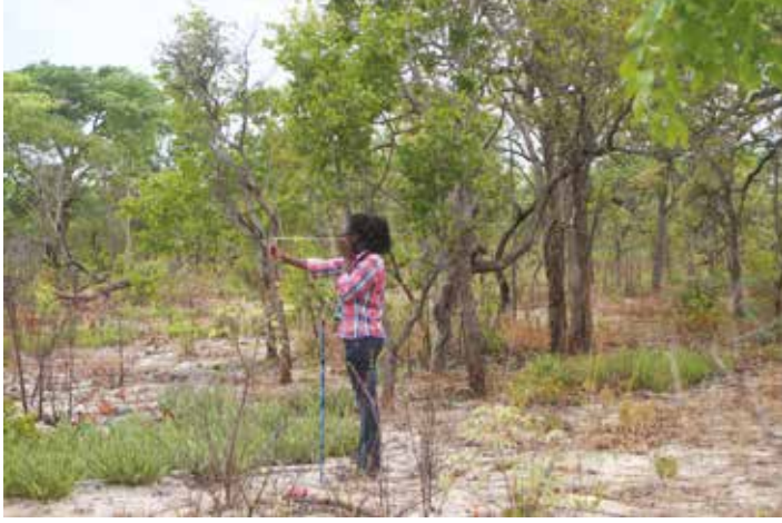
Siswaniso sa pili : Tatubo ya fokufita likota mwa sibaka mwa patisiso ya kwande (Siingilwe ki: N. Baptista)

Mukwa wa patisiso yamwa sibaka i lumelela litaba ku fumanwa fa sibaka ki likwata zenga mikoloko ya lika za mwa mishitu. Ikona kuba mukwa wo sa sinyi mashelefi kwa batu mwa lilalo zamwa sibaka. Sibakanyana mwa silalo sikona ku batisiswa, sina mikoloko ye tuna hai kona kutula ahulu. Ma plot kapa libaka za muubu ze inelezi za simululwa; ze likona ku batisiswa hañata, kakuya fa litokwahala za litaba.