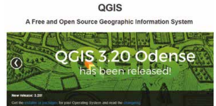
Sisupo sa bulalu: QGIS ki mutmo wo kwaluhile sibelekiso sa GIS sesi lumelela kufumanela lika kwahule ( https://qgis.org )

Ki kalulo yeo kuyona ku fumanwa litaba ni mañusa kuzwelela kwa lifulai kapa ma satellites. Maswaniso a sibaka kapa maswaniso a satellite akona ku sebeliswa kwaku ziba hande butungi bwa mushitu niku kulubela palo ya likota, kusunana kwa mushitu ni palo kamukana ya ze pila ze bupa likota. Mukwa wafa kaufi u lumelela ku tatuba makete a likota nako yelina ni matali. Litatubo ze kutelwa likona ku sebeliswa kwaku kulubela linceho kwa butungi bwa limela ni sibaka lilimo halinze liya. Litaba zekonile ku zibelwa kwa hule ikona ku sebeliswa kwaku lela patisiso ya mwa sibaka. Zibo ya ku lutiwa bucaziba ye lukisizwe ni mañolo a ma software ili mikwa ye belekiswa mwa kalulo ya zibo yabo mapangapanga a tokwahala kukona ku ku belekisa mukwa wa kufumanela mañusa kwahule kakuba sisebeliso mwa kueziwa kwa mukoloko wa lika kamukana. Sebeliso ya mukwa wa kufumanela mañusa kwa hule mwa Namibia i sitataliswa ki miluti ya likota ze apesize libaka za mishitu, kutisa maswaniso a shutana: I kopanya mibonahalelo ya likota, macacani, muubu ni fokuñwi maswayo a mililo, kutisa butata kwa ku lemuhela hande mushitu ni sibaka sa macacani.