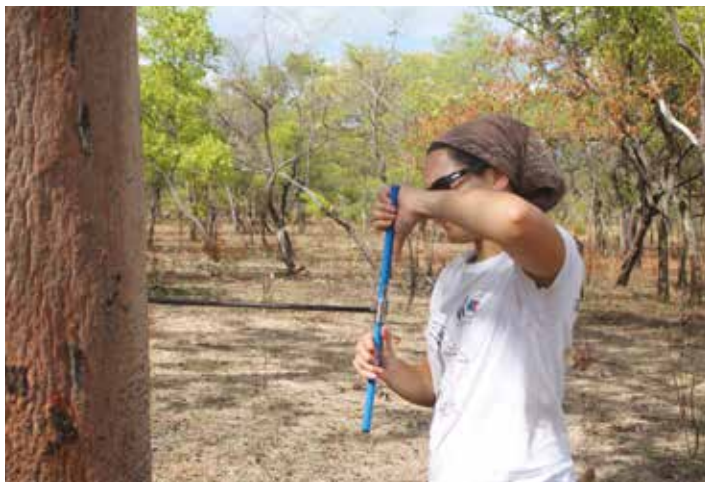
Siswaniso sa bulalu: Sebeliso ya sipangaliko sakuzwisisa kalulo yenyinyani hahulu ya simela se sipala kuziba silimo sa kota

Dendrochronology ki patisiso ya muhulelo ka silimo wa lisale kapa amañata fumaneha mwa hala likota kaku beya mubupelo wazona kwa lilimo ze tolokilwe kapa linako za silimo. I belekiswa kwaku ziba silimo sa likota niku tatuba moli alabela limela kwa mayemo a lihalimu a cincana kapa kucinca kwa mayemo a lihalimu. Mukwa wa kutatubisa lisale ni hakulicwalo, hau sebeliswi ahulu mwa Namibia bakeñisa kuli likota zeñata ze twaezi moku cisa halina lisake za mihulelo ya ka silimo, mi kuba teni ka silimo kwa lisale le ku lukela ku tatubiwa kwa mifuta kaufela ya likota za Namibia. Halutalima butata boo naha I talimani nibona kwa lineku la kucinca kwa mayemo a lihalimu, mukwa usili ukonile ku sebeliswa kwaku kulubela lilimo za mifuta ya likota za mabala kakuya ka butelel bwa masina a likota.