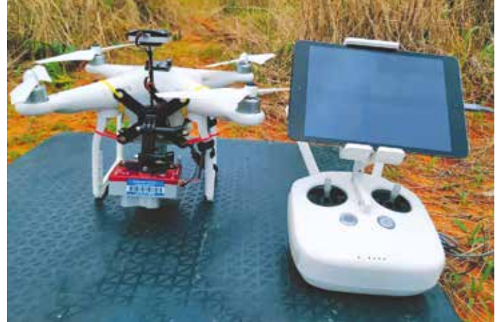
Siswaniso sa bubeli: Drone ye belekiswa kwa kutatuba sibaka sesi apesizwe ki limela

Nzila ya kuunga maswaniso kaku belekisa sipangaliko sesi lelezwi ku fufiswa nikungela maswaniso mwa mbimbyulu ki nzila ye ipitezi yaku eza mukoloko wa limbule za limela. I lumelela ku tatuba kapilipili ni kaswanelo limela nifoli fita ni butelele bwa likota ni mwa libaka koku zwelapili. Kwa libaka za libima ze ñata, li cipile kufita maswaniso a shimbezwi mwa mbimbyulu ka mukwa wa satellite a bonahala kuswana. Sebeliso yama drone ki nzila ye tokwa zibo ya za mihala ye ipitezi ni zibo yaku bukeleza, yekona ku fumanwa ka silikani sa swalisano ni tutengo totu cwale ka likolo za tuto ye pahami zekona kueza lipatisiso za sibaka moku pila lika kaku sebelisa drone. Lipatisiso zeñwi za sibaka lisa batahala kwa kupima, sina butelele mwa likota, taba ya butokwa kwa mikoloko ya limbule zamwa mushitu.